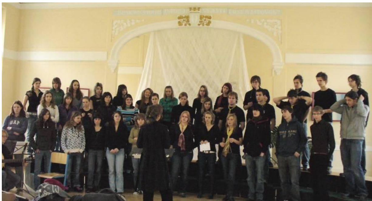
Ukázka z rozezpívání

Dne 10. 3. 2009 jsme zpívali v Litovli na přehlídce gymnaziálních pěveckých sborů.