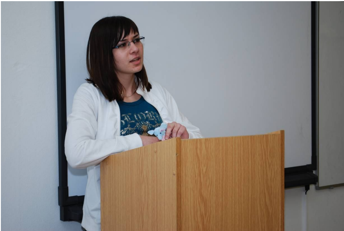
Ze soutěže Mladý Démosthenes