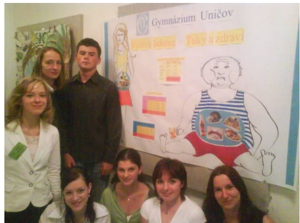
Členové kroužku u posteru