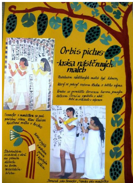
Část společné práce