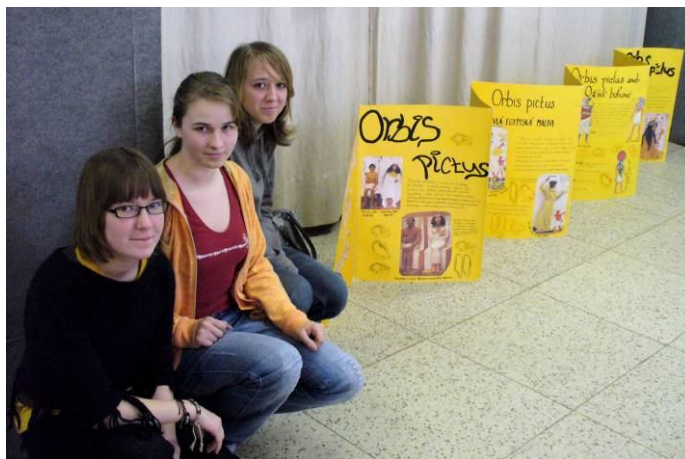
Ocenění v krajském kole v Olomouci