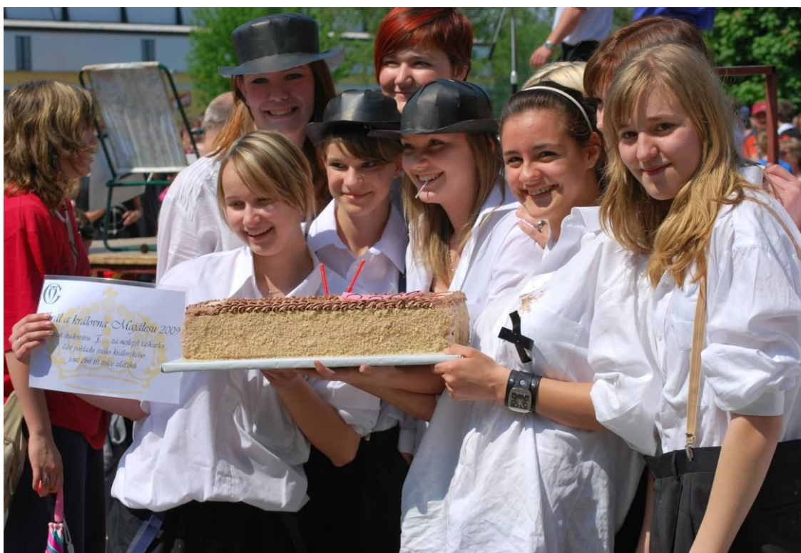
Studentky kvinty s dortem pro vítěze