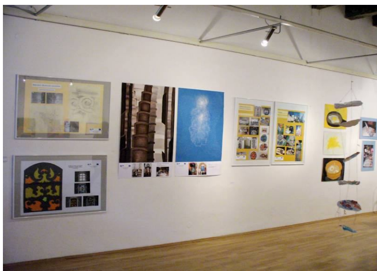
Naše práce na výstavě v Olomouci

V listopadu 2009 získal náš projekt „Oživlé baroko“ čestné uznání na Olomouckém bienále, což je krajská přehlídka výtvarných prací.