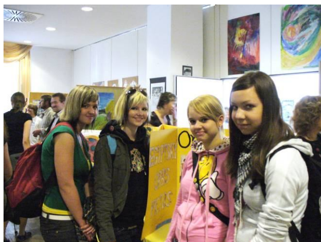
Ocenění v celostátním kole ve Vimperku