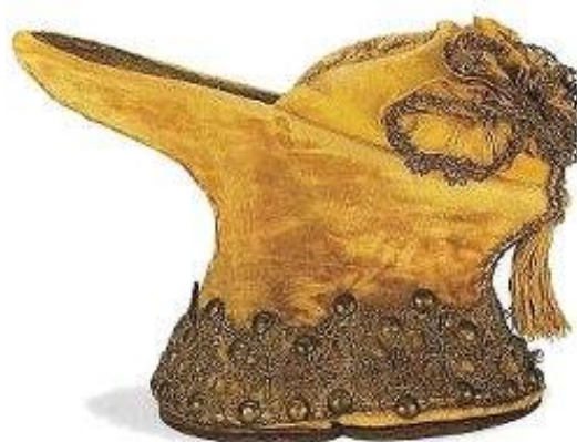
Chopinky z Turecka

Ve 14. století začíná vláda platformové obuvi, tzv. chopine. Zvláštní je, že se tyhle extravagantní boty prošlapaly do Evropy a Benátčanky jim podlehly nejvíce. Kvůli výšce, osmdesáti centimetrům, nemohly vyjít bez doprovodu ani na procházku.