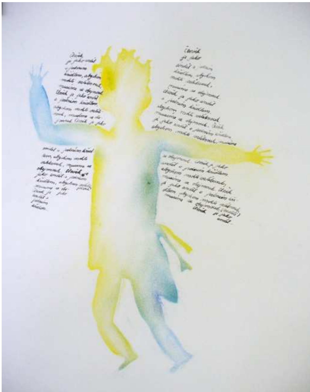
Punčochářová Pavla sekunda „Můj anděl“